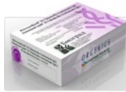
Тест-системы ИммуноКомб для диагностики Хеликобактериоза

узконаправленным мероприятиям целевого характера с акцентом на защиту конкретных людей, подвергающихся риску инфицирования и сократить расходы государства, обусловленные последствиями социально значимых заболеваний.