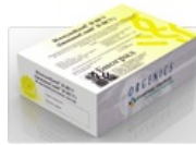
Тест-системы ИммуноКомб для диагностики Гепатитов А, В и С