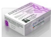
Тест-системы ИммуноКомб для диагностики Хеликобактериоза