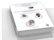
Практическое руководство для врачей по диагностике TORCH-комплекса