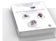
Практическое руководство для врачей по диагностике TORCH-комплекса