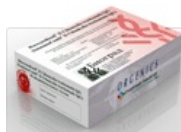
Тест-системы ИммуноКомб для диагностики TORCH-комплекса