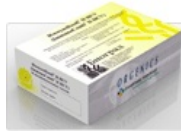
Тест-системы ИммуноКомб для диагностики Гепатитов А, В и С

странах мира. Как достоверные, высокочувствительные и специфичные тесты ИммуноКомб отобраны для программ ВОЗ, UNAIDS, Красного Креста, допущены FDA (США) для поставок по специальным программам фонда Клинтона. Минздравсоцразвития рекомендует тесты ИммуноКомб для обследования доноров крови, органов и тканей человека, скрининговых исследований; для подтверждения результатов скрининговых исследований (приказ № 292 от 30.07.2001, № 322 от 21.10.2002, № 336 от 07.09.2000).