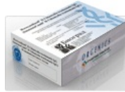
Тест-системы ИммуноКомб для диагностики ВИЧ-инфекции