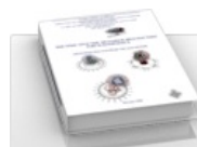
Практическое руководство для врачей по диагностике TORCH-комплекса