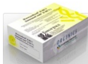
Тест-системы ИммуноКомб для диагностики Гепатитов А, В и С